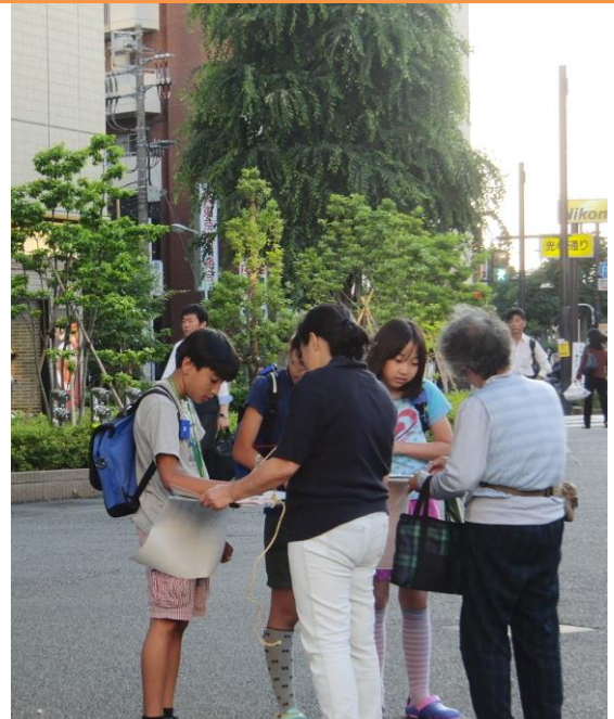
署名は多くの子供たち、女性や外国人も応じてくれました。

九条の会・品川は、6月～7月雨の日を除く毎夕、大井町駅前「戦争法案は廃案に！」「九条にノーベル平和賞を！」の署名宣伝を行い、およそ1000名近く署名を集めました。8月からは、安倍首相や国会議員宛のレッドカードはがき・要請はがき300枚を配布・投函し、9月からは連日宣伝を再開しています。憲法九条をないがしろにする戦争法案は絶対に認められません！