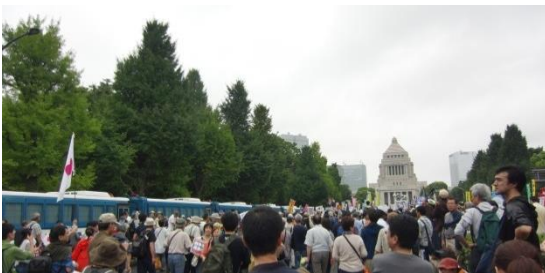
8・30国会10万人集会に小雨まじりの中12万人が集まりました（遂に車道に溢れ、続々と集まる参加者）